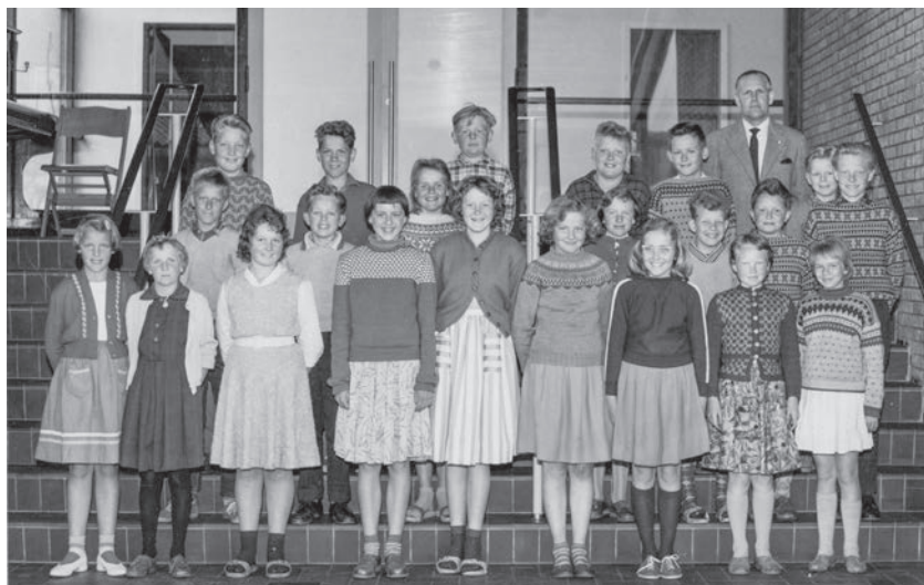
5. klasse på Allinge-Sandvig Borgherskole (nr. to dreng fra højre er mig).

Når man tænker på, hvordan indstillingen i dag er til revselse af børn, kan man undre sig over, at det så sent som i 50'erne var ganske almindeligt, at en lærer kunne give en elev en øretæve. Jeg husker specielt engang, hvor vi var nogle drenge, der var kommet op at slås inde på toiletterne i gården. Da gårdvagten opdagede det, fik vi valget mellem at få en på siden af hovedet eller at få en eftersidning. Vi valgte alle det første, og så havde vi ellers bare at stille pænt op på en række, så dommen kunne eksekveres. Og vi fik en øretæve, så det sang. Samme lærer blev i øvrigt siden skoleinspektør på en anden af Bornholms skoler. Jeg ved ikke, hvor længe han fortsatte sin praksis med øretæverne, men det ophørte jo nok, da der i 1967 blev indført forbud mod korporlig afstraffelse