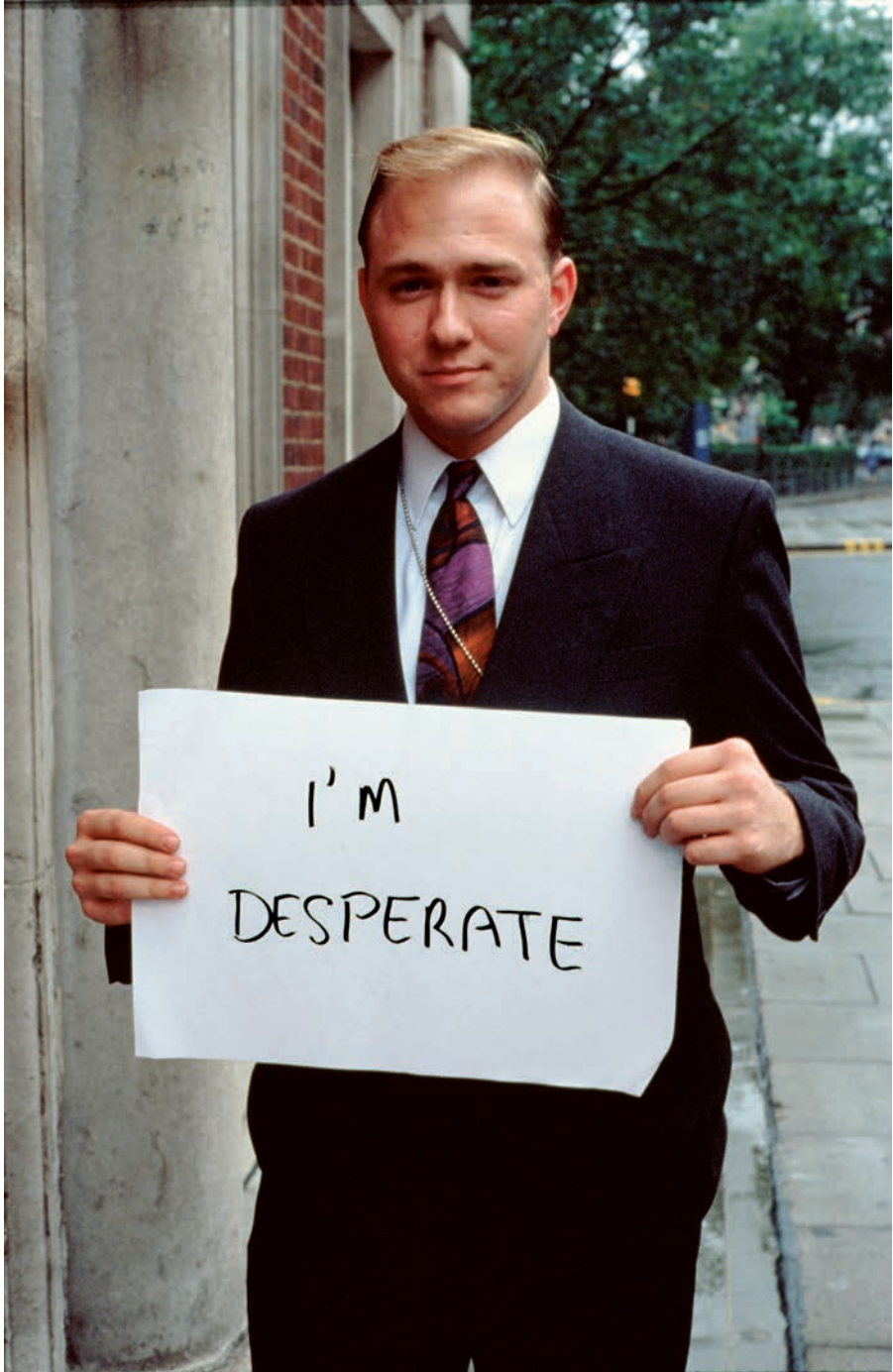
Gillian Wearing: Signs That Say What You Want Them To Say And Not Signs That Say What Someone Else Wants You To Say I'M DESPERATE (1992-1993)