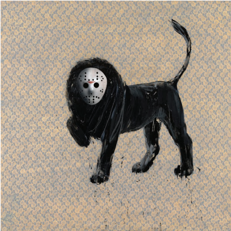
Charming Baker: Just One Of The Many Gods I Don't Believe In (2010)