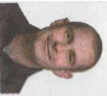
Anmeldt af Josua Christensen

Hvis vi ville fjerne Jesu opstandelse, hans undergørringer og alle påstande og antydninger om hans guddommelighed, så ville alle være enige om at anse Det Nye Testamente for at være den mest korrekte og komplette historiske kilde om jødisk liv i det første århundrede i Palæstina. Men nu findes jo opstandelsen, miraklerne og Jesu guddommelighed der, og derfor er der blevet gjort og gøres stadig utallige forsøg på at miskreditere dets pålidelighed, men forgæves. (s. 199)